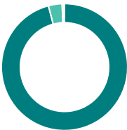
Répartition de l'actif (%)