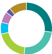
Répartition de l'actif (%)