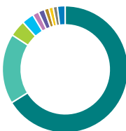
Répartition géographique (%)