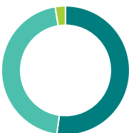
Répartition de l'actif (%)