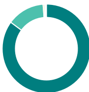
Répartition sectorielle (%)