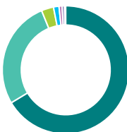
Répartition géographique (%)