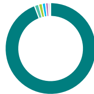
Répartition géographique (%)