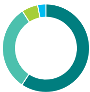
Répartition de l'actif (%)